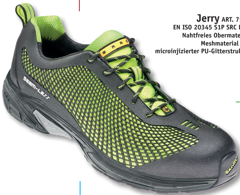
Jerry ART. 7547 EN ISO 20345 S1P SRC HRO Nahtfreies Obermaterial Meshmaterial mit microinjizierter PU-Gitterstruktur