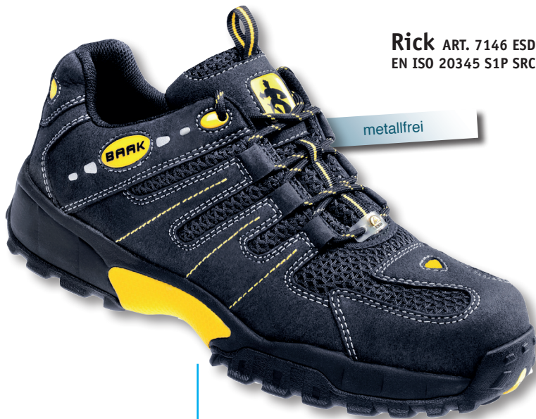
Rick ART. 7146 ESD EN ISO 20345 S1P SRC