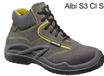
Albi S3 CI SRC