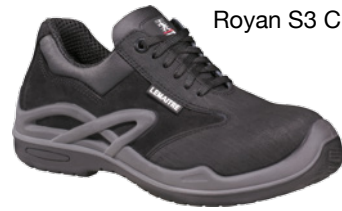
Royan S3 CI SRC