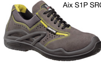
Aix S1P SRC