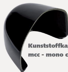
Kunststoffkappe - mcc - mono coque cap