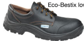
Eco-Bestix low S3 SRC