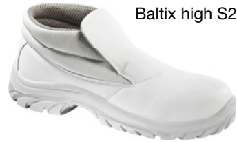
Baltix high S2 SRC