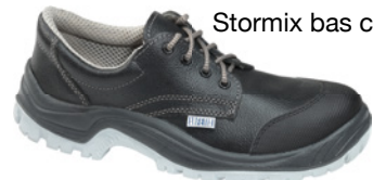
Stormix bas cap S3 CI SRC