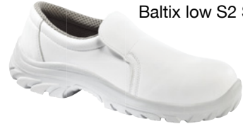
Baltix low S2 SRC