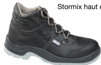
Stormix haut cap S3 CI SRC