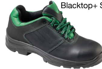
Blacktop+ S1P SRC