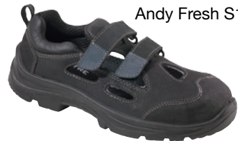
Andy Fresh S1P SRC