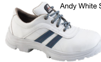
Andy White S3 SRC