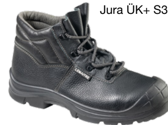
Jura ÜK+ S3 SRC