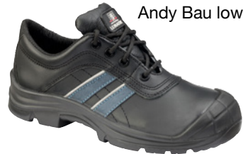
Andy Bau low S3 SRC