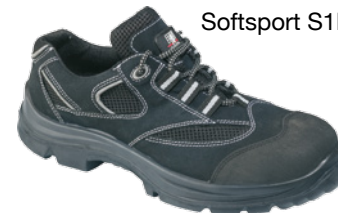
Softsport S1P SRC