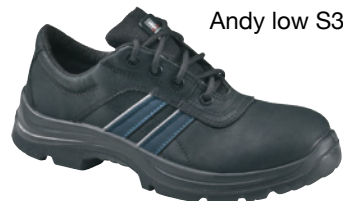
Andy low S3 SRC